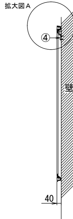
壁面取り付け状態